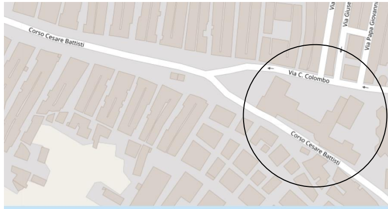
Istituto comprensivo Pietro Giannone (Ischitella)