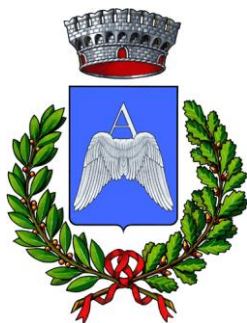
COMUNE DI ALLISTE

Allegato al DPPS/I - Comune di ALLISTE/MELISSANO Descrizione del sistema scolastico ed educativo