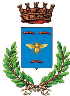
COMUNE DI MELISSANO